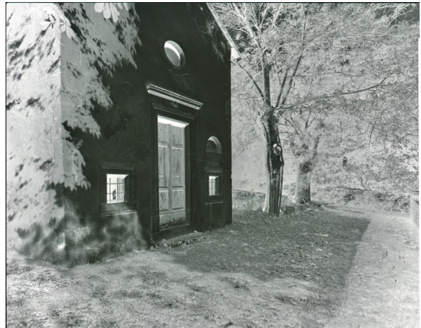
D72 A 6