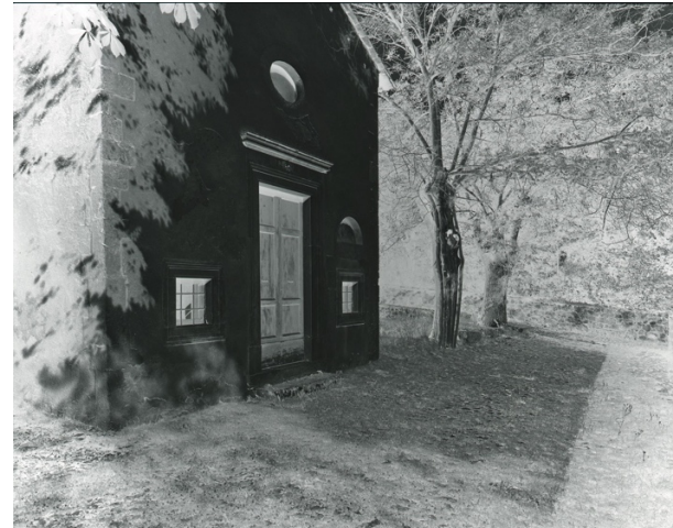
D72 A 8