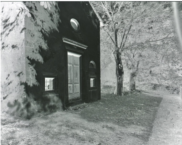
D72 A 7