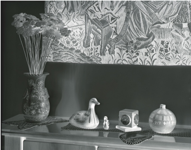
D72 A 1