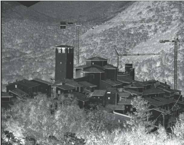
D72 A 3