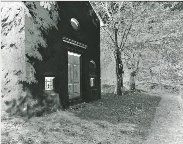
D72 A 5